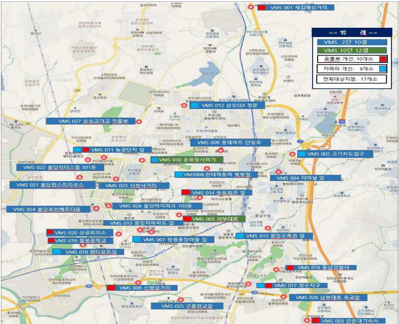
도로전광표지판(VMS) 교체 설치